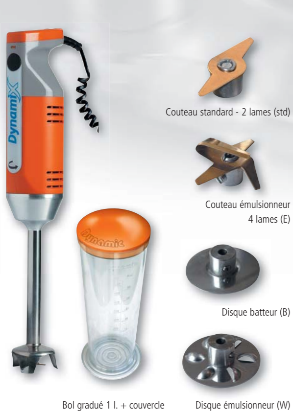
Bol gradué 1 l. + couvercle