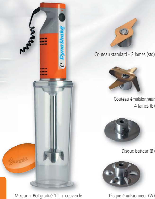
Mixeur + Bol gradué 1 l. + couvercle