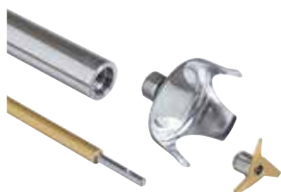
Pie y campana totalmente desmontables